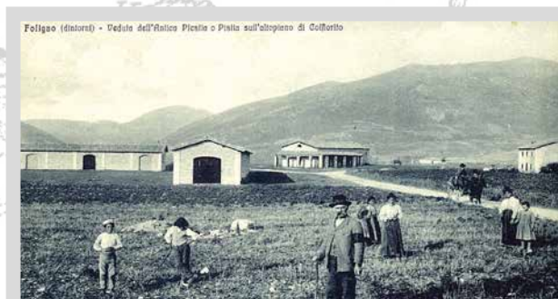
Foligno (dintorni) - Veduta dell'Antico Plescio o Plesio sull'altopiano di Colfiorito